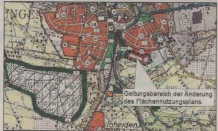
Abbildung: Übersichtsleageplan der Änderung des Flächennutzungsplans (FNP) der Stadt Hungen (Kartengrundlage: Auszug aus dem FNP der Stadt Hungen, unmaßstäblich, genordet)

Der Geltungsbereich des Bebauungsplanes umfasst eine Fläche von ca. 1,85 ha. Die Lage und Abgrenzung des Plangebietes ist auf den nachfolgenden Abbildungen dargestellt.