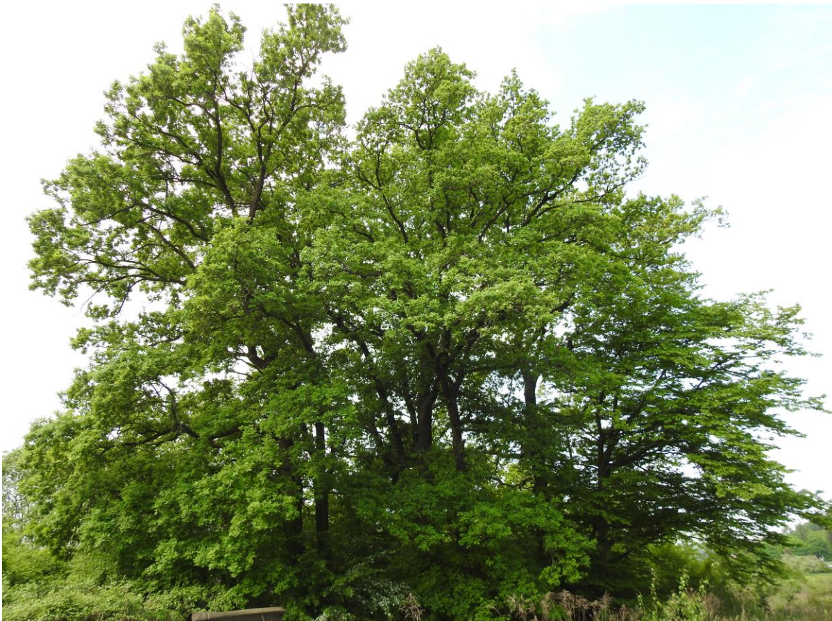
Abb. 5: Baumgruppe mit sechs Stieleichen ( Quercus robur ) und Vogelkirschen ( Prunus avium )

Status: kein gesetzlicher Schutz gemäß § 13 HAGBNatSchG