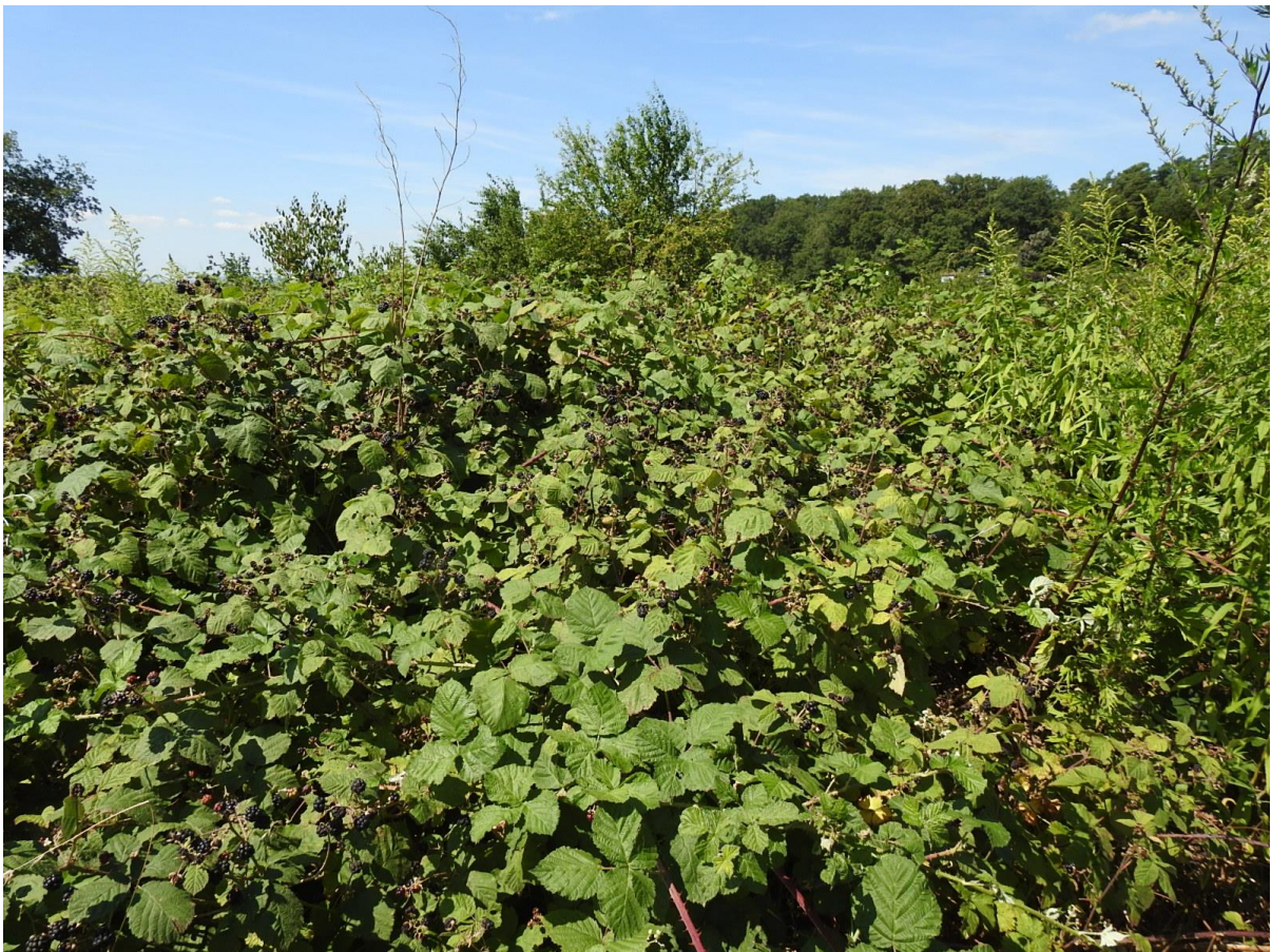
Abb. 7: Großflächiges Brombeergebüsch im Süden der Vorhabensfläche

Status: kein gesetzlicher Schutz gemäß § 13 HAGBNatSchG