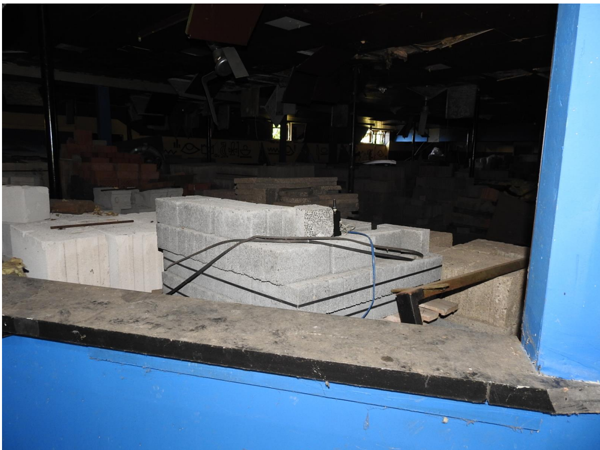
Abb. 3: Innenbereich des ehemaligen Discogebäudes

Status: kein gesetzlicher Schutz gemäß § 13 HAGBNatSchG