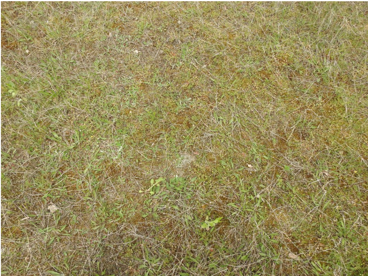
Abb. 8: Ausdauernde Brachegesellschaft auf trockenem Standort

Status: kein gesetzlicher Schutz gemäß § 13 HAGBNatSchG