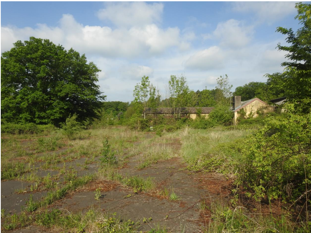
Abb. 4: Ehemalige Parkplatzflächen mit Brachecharakter

Status: kein gesetzlicher Schutz gemäß § 13 HAGBNatSchG