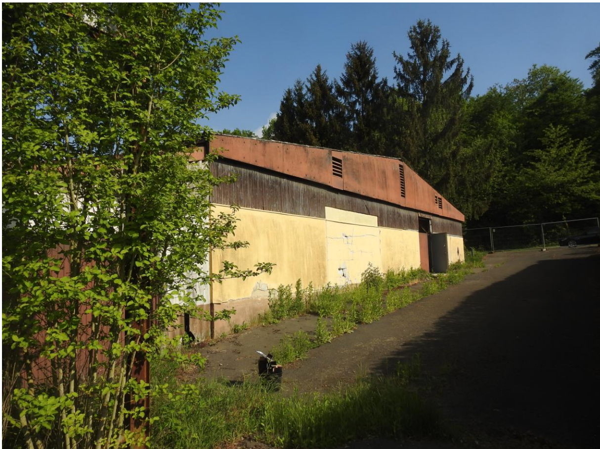
Abb. 2: Teilansicht des Vorhabensbereich, Gelände der ehemaligen Disco