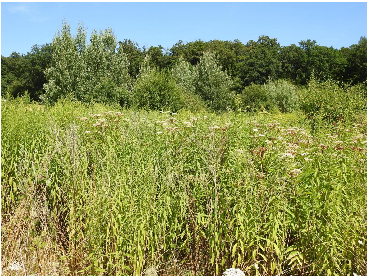
Abb. 6: Ausdauernde Brachegesellschaft auf trockenem Standort

Status: kein gesetzlicher Schutz gemäß § 13 HAGBNatSchG