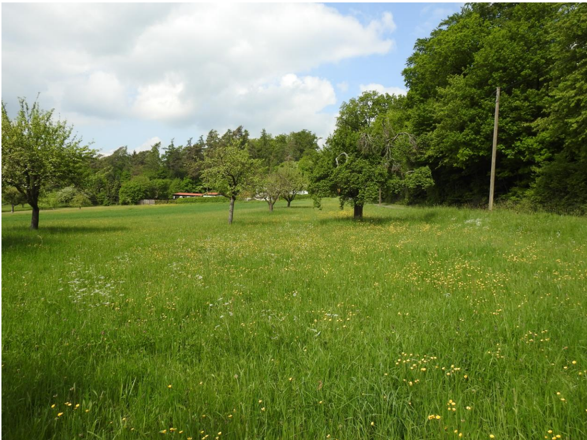
Abb. 9: Streuobstwiese mit Magergrünland

Status: gesetzlicher Schutz gemäß § 13 HAGBNatSchG